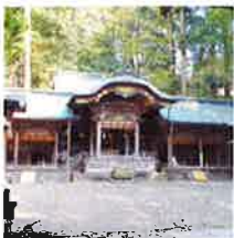
諏訪大社 上社本宮