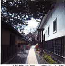
修景地区 栗の小径