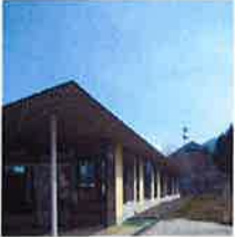
まちとしょ テラソ